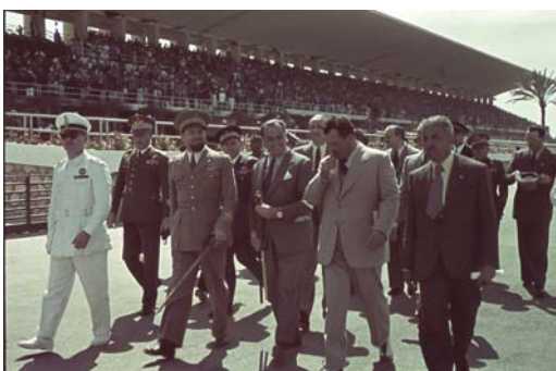
Luftmarschall Italo Balbo, Generalgouverneur der italienischen Provinz Libyen, galt als hervorragender Gastgeber (3. v. l.,).

Hinsicht attraktivem Reiseziel. Seit 1911 steht Libyen unter italienischer Besatzung, seit 1934 ist der Staat italienische Provinz. Generalgouverneur Italo Balbo, von Mussolini eingesetzter Luftmarschall und Lebeamann, installiert das seinerzeit attraktivste Autorennen der Welt: den Großen Preis von Tripolis. Sommerliche Hitze, exotisches Ambiente, rauschende Feste und üppige Preisgelder schaffen das rechte Klima für den Rennsport. Der wird in diesem Jahr überdies zum Politikum. Die Italiener, die das Rennen zum letzten Mal 1934 gewonnen haben, verändern das Regelwerk so, dass es zu ihren Autos passt. Mercedes bleiben gerade acht Monate Zeit, um seine Silberpfeile regelkonform zu entwickeln. Trotz größter Skepsis treten Hermann Lang und Rudolf Caracciola mit dem neuen W 165 an, um, wie schon in den Jahren 1937 und 1938, den dreizehn