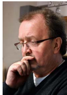
Entdecker: Sigggi Müller, Fotograf.

Die Diapositive wurden in Holzkästen eingelagert und gerieten in Vergessenheit. Erst kürzlich hat sein Sohn, Sigggi Müller, der das Geschäft vom Vater übernahm, die Farbdias wieder entdeckt.